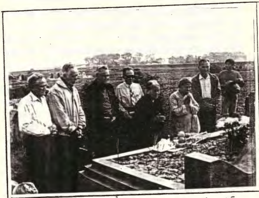
VIẾNG MỘ ÔNG NGUYỄN VĂN VĨNH TRÊN CÁN ĐỒNG LÀNG PHƯỢNG VŨ - PHÚ XUYÊN - HÀ TÂY

Hà Nội, ngày 1/1/1999 Các con, cháu và chất Ông Nguyễn Văn Vĩnh