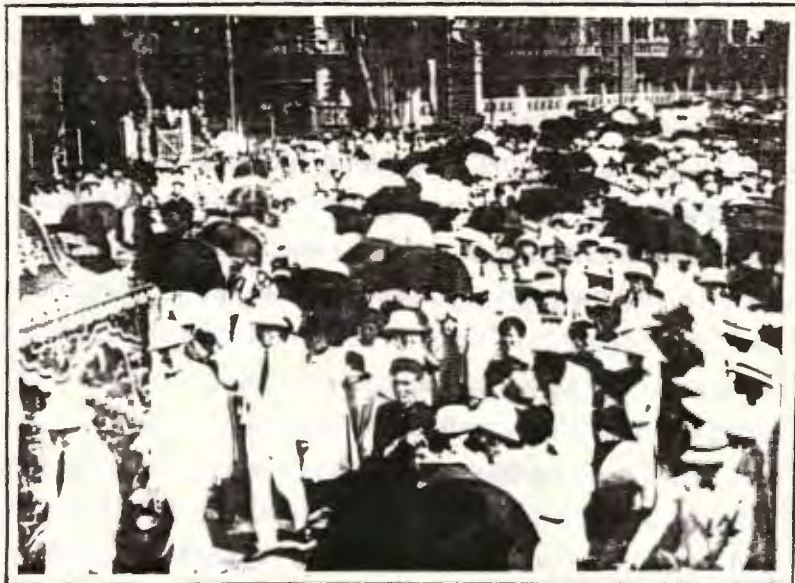
8-5-1936 - ĐÁM TANG ÔNG NGUYỄN VĂN VĨNH