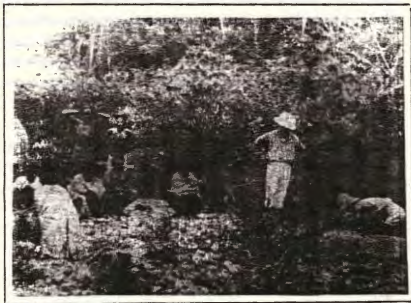
27-4-1936 NHỮNG NGÀY CUỐI CÙNG CỦA ÔNG NGUYỄN VĂN VĨNH Ở BÊN LẠO