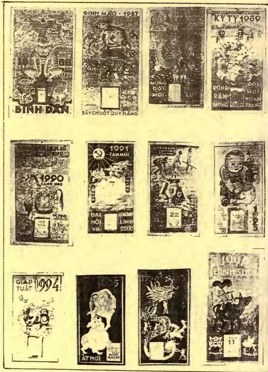
15 NĂM CUỐI CÙNG CỦA THẾ KỶ XX