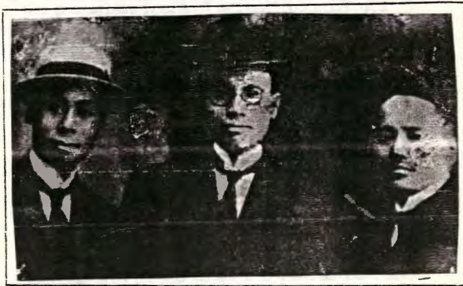
PHẠM DUY TÔN PHẠM QUỲNH NGUYỄN VĂN VINH