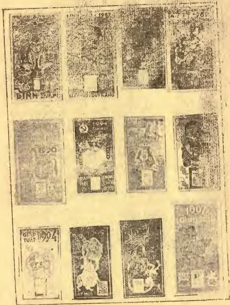
15 NĂM CUỐI CÙNG CỦA THẾ KỶ XX

1001 BÀI BÁO "L'ANNAM NUOUEAU" Tập 20 - tháng 12 năm 2000