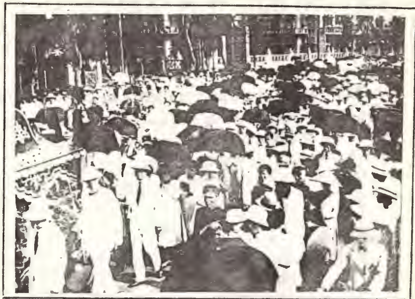
- Các đồng nghiệp và bạn thân đi quanh xe tang